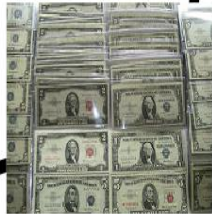
Monnaie de papier